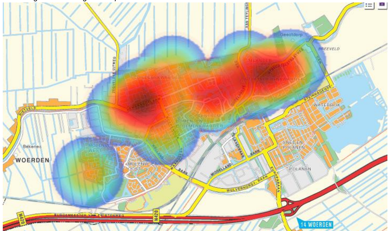
Afbeelding: visuele weergave hotspots Woerden

Hieronder zijn de visuele weergaves van de locaties waar de meeste registraties zijn vastgelegd weergegeven. Vanwege de aantallen, zijn alleen de plaatsen Woerden en Harmelen hieronder opgenomen.