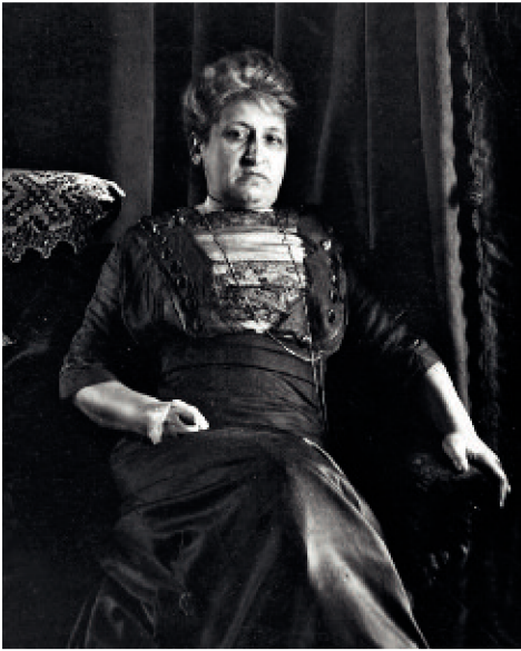
Dr. Aletta Jacobs, eerste vrouwelijke arts in Nederland. Feministe, voorvechtster vrouwenkiesrecht. Portret, 1912.

Bron: Nationaal Archief of the Netherlands, Spaarnestad Photo, SFA001002575.