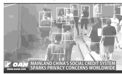
China Behavior Rating System V/S Sweden Microchip implants | Must watch technology

https://www.youtube.com/watch?v=3FMWcLZy3jU