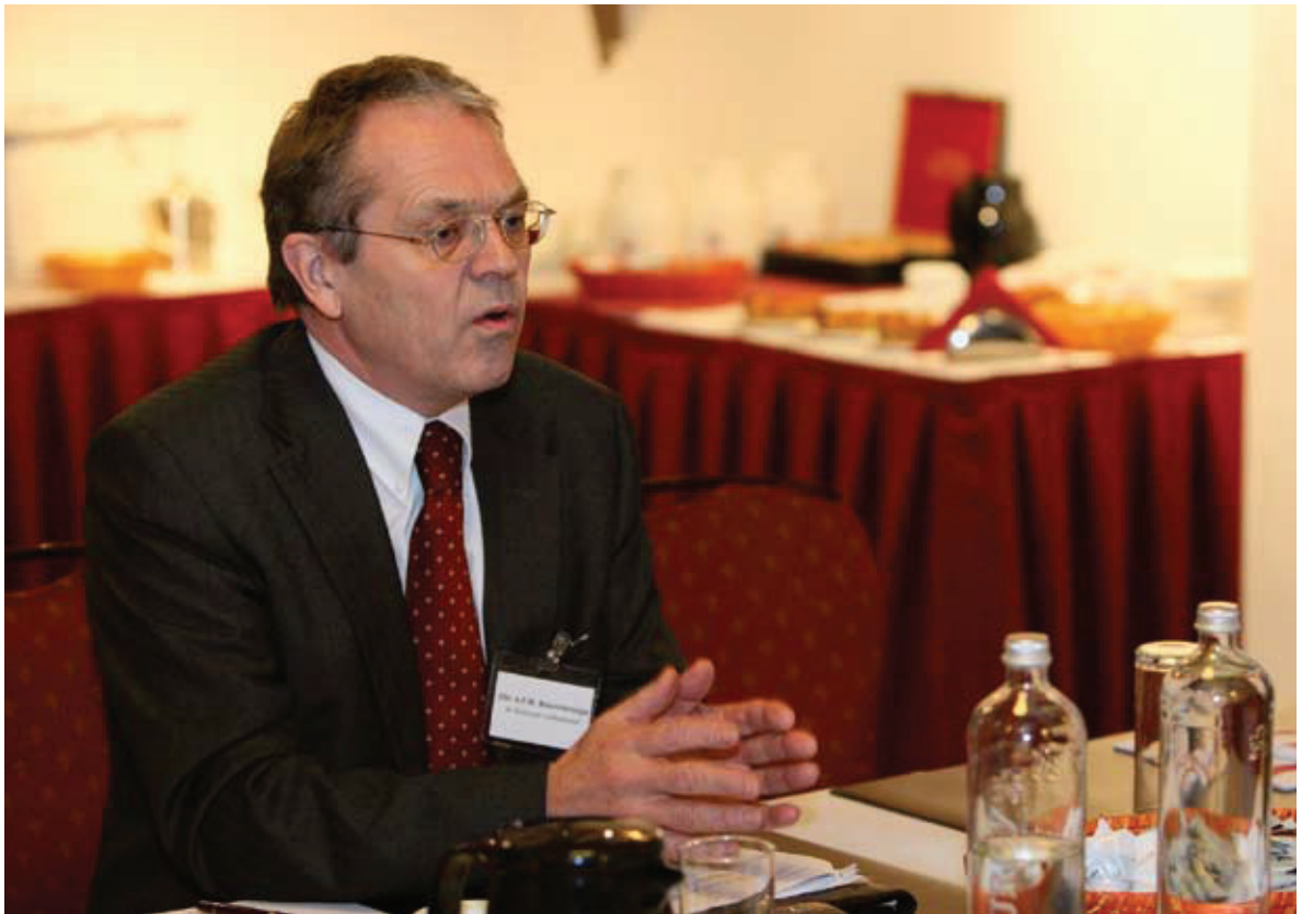
De Nationale Ombudsman, dhr. Benninkmeijer, tijdens een rondetafelgesprek over de code voor goed openbaar bestuur op 27 november 2008 te Utrecht.