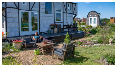
Duinvallei, Katwijk (Bluemonque)