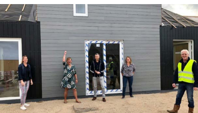
Buurtkap de Tuunen, Texel