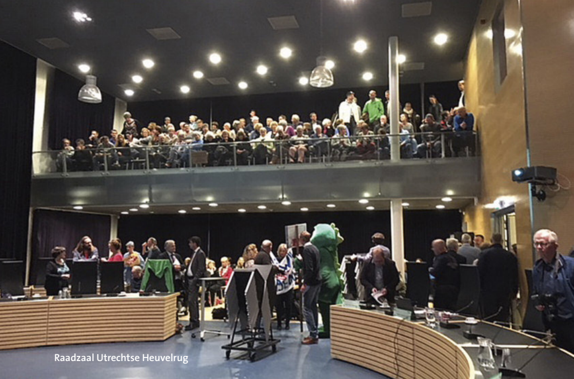
Raadzaal Utrechtse Heuvelrug

Inwoners zitten niet te wachten op gehacketak en politiek gedoe. Zoek als politieke partijen naar wat je bindt, niet naar wat je verdeelt. [Hugo Prakke]