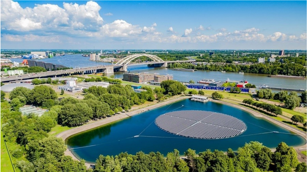
Drijvend zonnepark, Waterbedrijf Evides, Rotterdam

financiële zin te combineren. Ontwerpend onderzoek in combinatie met gesprekken met betrokkenen zijn belangrijk om de mogelijkheden te verkennen.