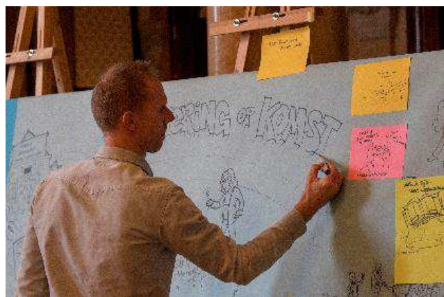
JAM aan het werk