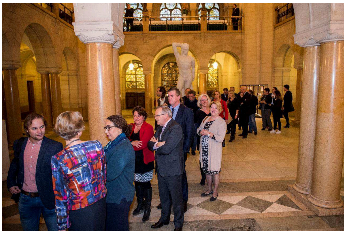
'Het lijkt hier wel een stembureau'. In de rij bij de registratie.