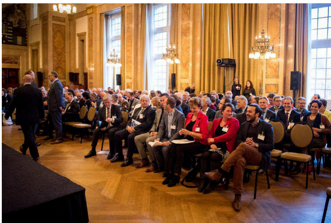
Even na 10.00 uur: we gaan beginnen!