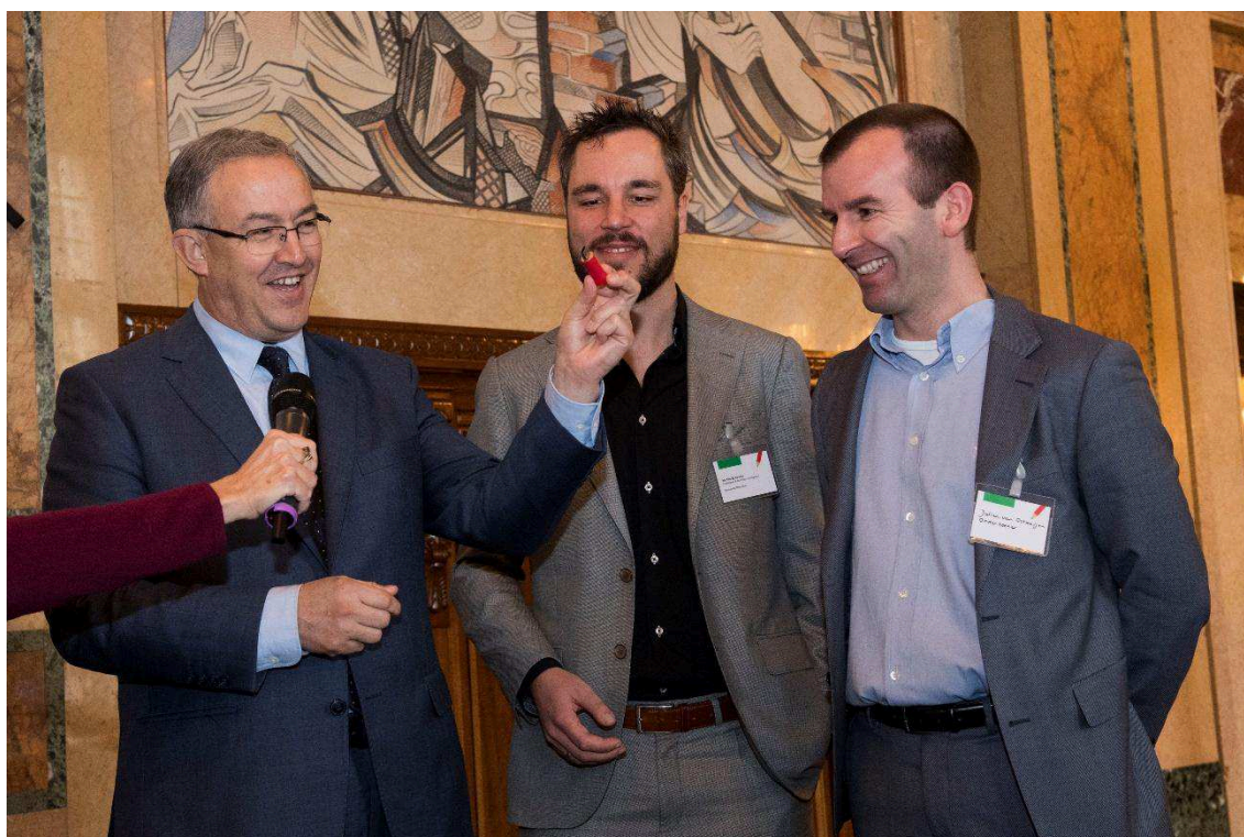
Het rapport op een stempotlood