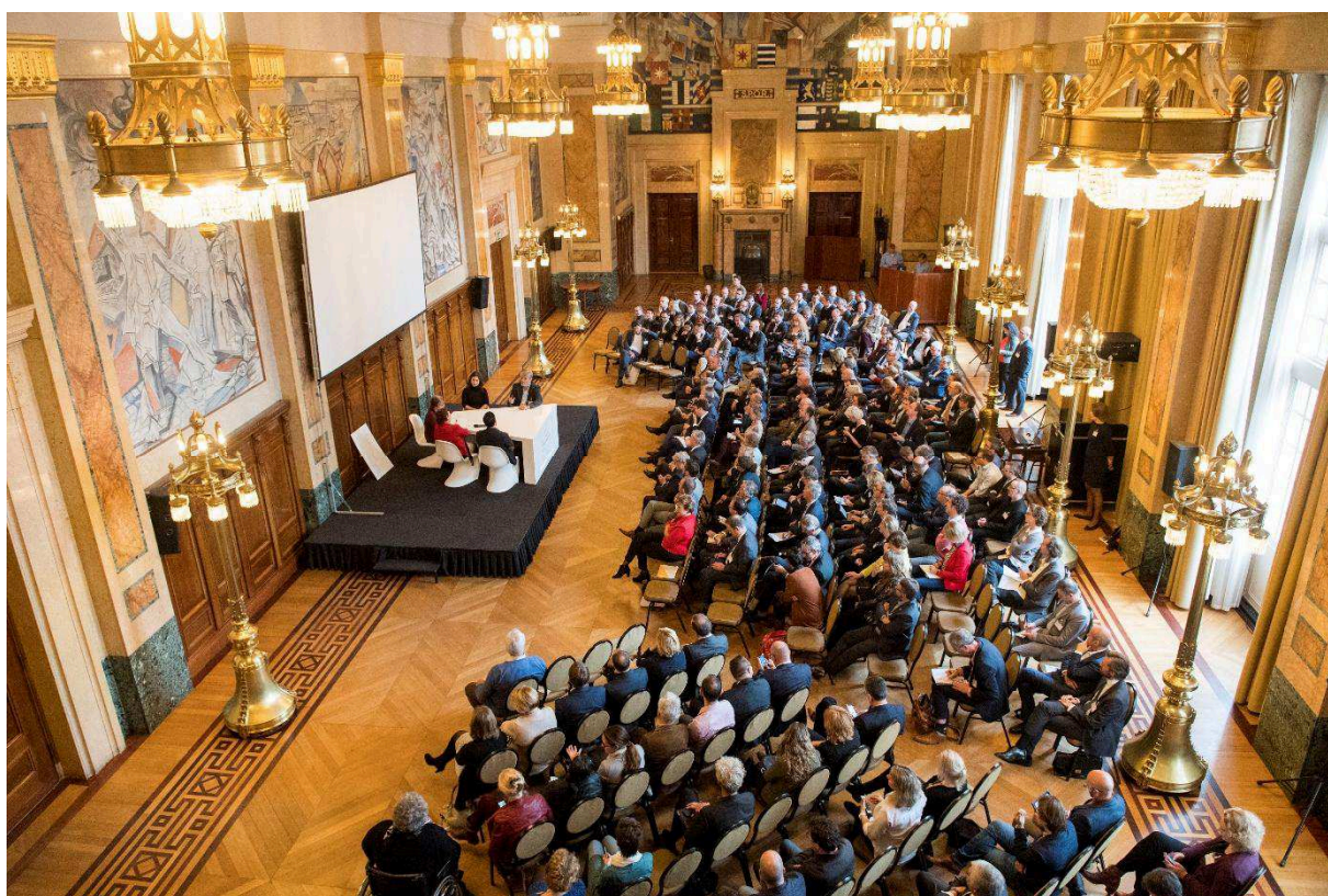
Overzichtsfoto tijdens seminar in Burgerzaal stadhuis Rotterdam