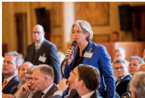
Reacties uit de zaal