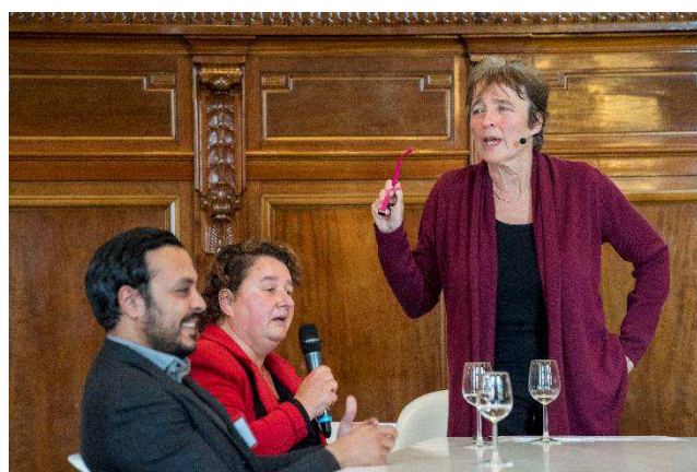
Laat je gezicht zien in de stad