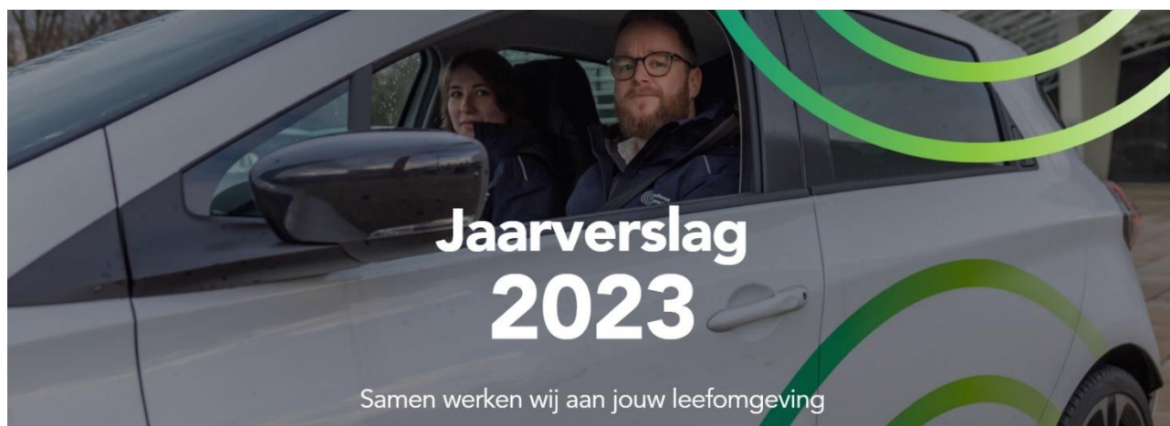
Figuur 1 - https://odru2023.jaarverslag.org/

In het jaarverslag wordt verantwoording afgelegd over de realisatie van de vooraf gestelde doelen zoals opgenomen in de begroting 2023. Wij zijn trots op onze inhoudelijke resultaten en willen u daarom een korte terugblik geven op 2023. U kunt het jaarverslag bekijken door op onderstaande afbeelding te klikken.