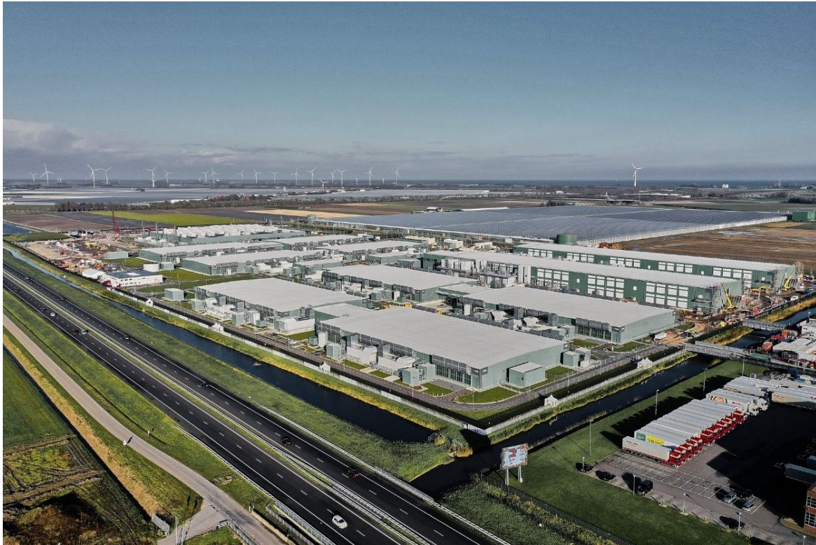
Overzicht situatie Datacenter Middenmeer 70 ha