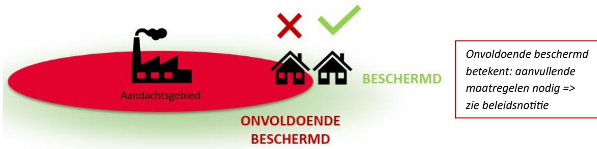
Figuur 1: Het concept aandachtsgebieden.