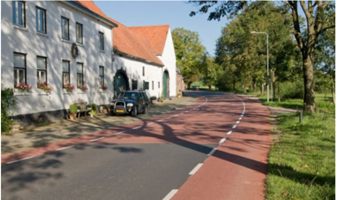
Figuur 2: voorbeeld accentueren gevaarlijke situaties

knelpunten en weinig weggebruikers of zijn juist net opgeknapt. Het pakket maatregelen voor de genoemde vijf wegen bestaan uit het accentueren van gevaarlijke locaties (natuurlijk sturen), het verbeteren van de bestaande passeerhavens en het aanbrengen van nieuwe passeerhavens waar nodig.