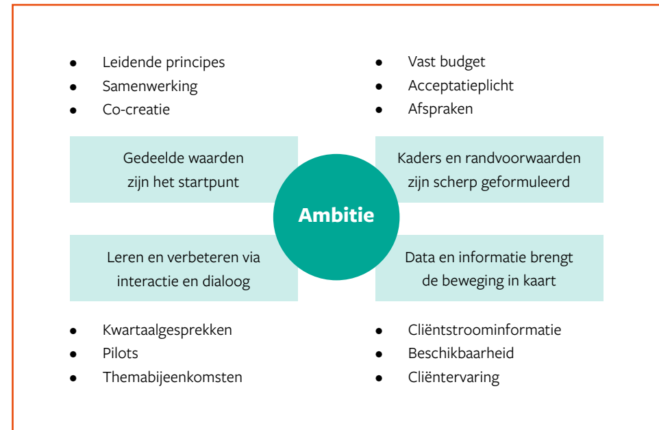
FIGUUR 2: HET UTRECHTSE MODEL

We doen dit als 16 gemeenten samen en betrekken cliënten, toegangspartijen en aanbieders hierbij. Ook zoeken we verbinding met andere partners, zoals woningcorporaties