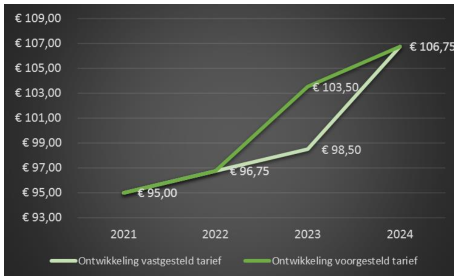
FIGUUR 2: TARIEFONTWIKKELING VASTGESTELD EN VOORGESTELD TARIEF. HET WEERGEGEVEN TARIEF 2024 IS LAGER DAN HET BIJ KADERNOTA 2024 VASTGESTELDE TARIEF VAN € 110,50 OM HET QUA SYSTEMATIEK VERGELIJKBAAR TE HOUDEN MET DE JAREN DAARVOOR.

ODRU stelt daarom voor om nu het tarief (eenmalig en alleen) voor 2023 te verhogen met € 5,- ten opzichte van het tarief zoals vastgesteld in de Kadernota 2023. Het nieuwe tarief voor 2023 wordt dan € 103,50. Deze tariefsverhoging werkt dus voornamelijk niet door in het tarief en de begroting van 2024. We hanteren bij de tariefsverhoging voor 2023 de systematiek zoals gebruikelijk bij de Kadernota, met een indexering voor loon- en prijsstijgingen. Figuur 2 laat de tariefontwikkeling zien. Hieruit blijkt dat de voorgestelde tariefsverhoging in een logische lijn ligt. In Bijlage 2 wordt de berekening en cijfermatige onderbouwing van deze verhoging toegelicht.