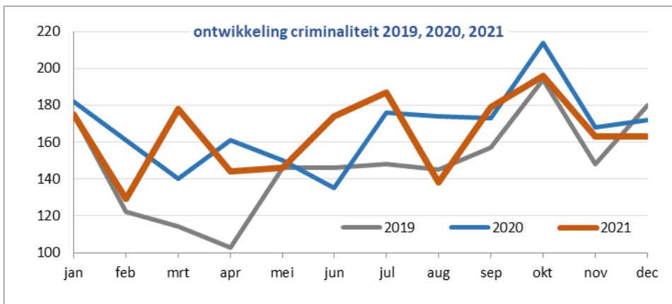
(Figuur 2 ontwikkeling criminaliteitscijfers Oudewater 2019,2020,2021)

Kijkend naar de geregistreerde criminaliteitscijfers over 2021 in de gemeente Oudewater (zie voor het totale overzicht bijlage 1) zien we terug dat de totale geregistreerde criminaliteit in de gemeente Oudewater met 4% is gedaald ten opzichte van 2020. Oudewater kent daarmee een iets minder gunstige ontwikkeling dan de gemiddelde regionale ontwikkeling (-10%). Zichtbare dalers in de geregistreerde criminaliteitscijfers zijn winkeldiefstal (-67%), brom-, snor-, fietsdiefstal (van 21 naar 12, -43%), jongerenoverlast (van 47 naar 33, -30%) en woninginbraak (van 38 naar 19, -50%). Deze vier delicten daalden harder dan het regionaal gemiddelde. Woninginbraak staat zelfs op het laagste punt sinds 2018. Vanwege de lage absolute aantallen in Oudewater kunnen procentuele stijgingen en dalingen snel groot zijn.