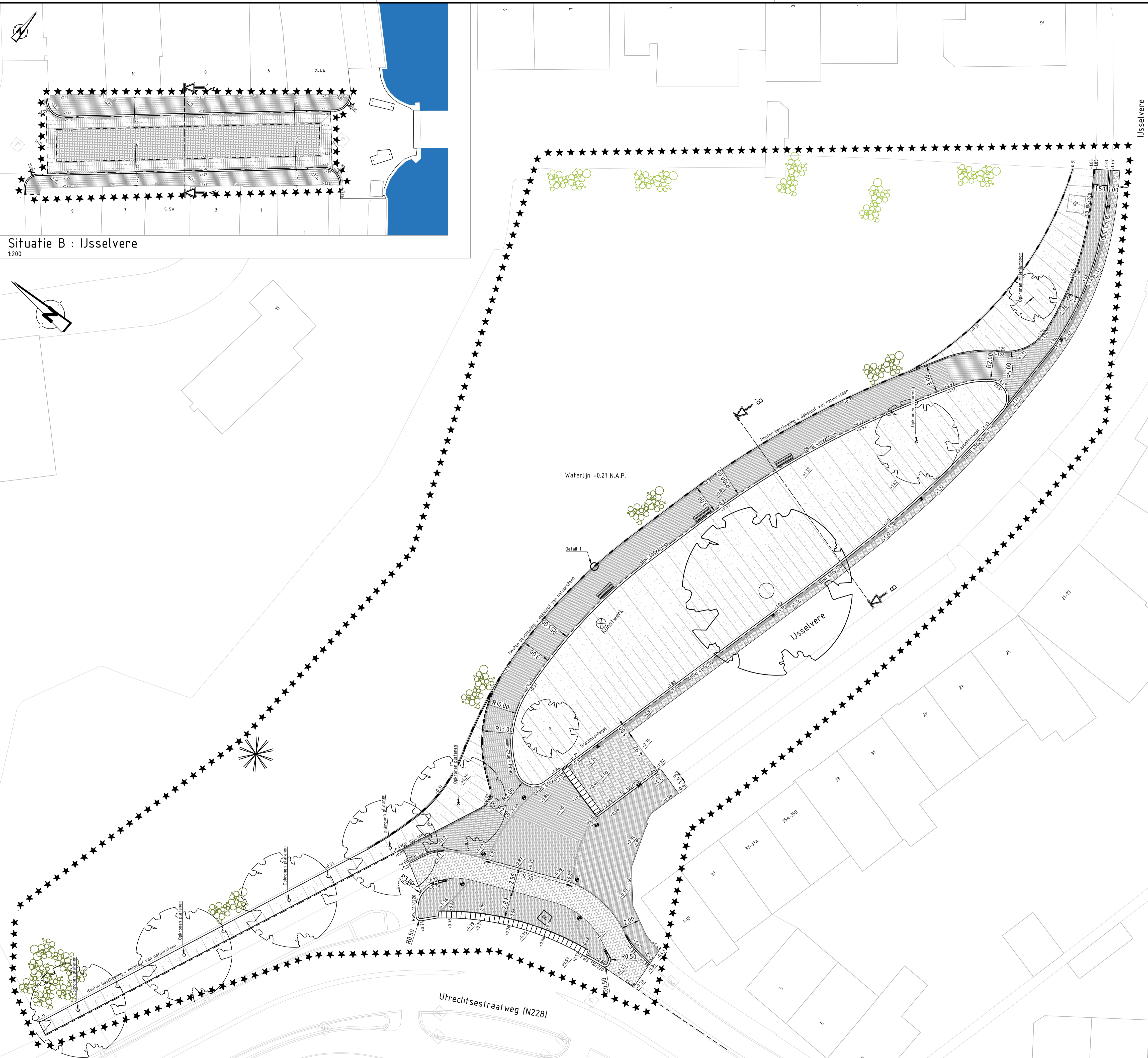
Situatie B : IJsselvere