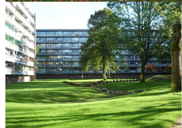
Foto's: wadi flatwijk in Soest bij droog en nat weer