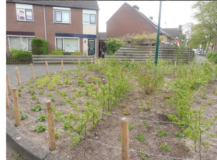
Foto: Vergroenen in de buurt in Wijk bij Duurstede Beeldmateriaal Werkgroep Stenenbrekers Wijk Bij Duurstede