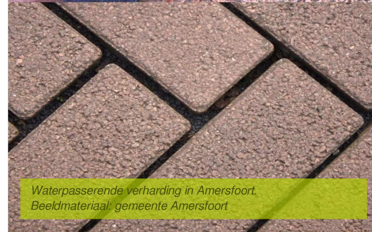
Waterpasserende verharding in Amersfoort.