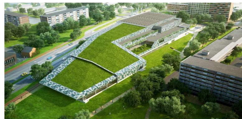
Foto: Groen dak, zwembad Amarena, Amersfoort.

„Pak de opgave in de volle breedte aan en maak met veel partijen plannen en acties!”