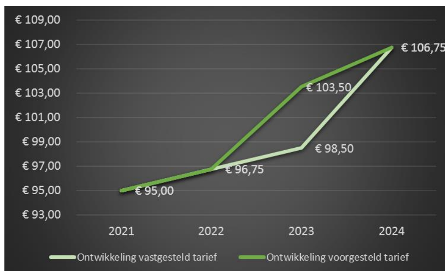
FIGUUR 2: TARIEFONTWIKKELING VASTGESTELD EN VOORGESTELD TARIEF. HET WEERGEGEVEN TARIEF 2024 IS LAGER DAN HET BIJ KADERNOTA 2024 VASTGESTELDE TARIEF VAN € 110,50 OM HET QUA SYSTEMATIEK VERGELIJKBAAR TE HOUDEN MET DE JAREN DAARVOOR.

ODRU stelt daarom voor om nu het tarief (eenmalig en alleen) voor 2023 te verhogen met € 5,- ten opzichte van het tarief zoals vastgesteld in de Kadernota 2023. Het nieuwe tarief voor 2023 wordt dan € 103,50. Deze tariefsverhoging werkt dus voornamelijk niet door in het tarief en de begroting van 2024. We hanteren bij de tariefsverhoging voor 2023 de systematiek zoals gebruikelijk bij de Kadernota, met een indexering voor loon- en prijsstijgingen. Figuur 2 laat de tariefontwikkeling zien. Hieruit blijkt dat de voorgestelde tariefsverhoging in een logische lijn ligt. In Bijlage 2 wordt de berekening en cijfermatige onderbouwing van deze verhoging toegelicht.