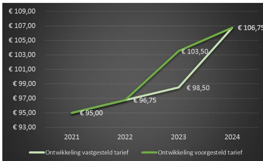
FIGUUR 1 TARIEFONTWIKKELING VASTGESTELD EN VOORGESTELD TARIEF. HET WEERGEGEVEN TARIEF 2024 IS LAGER DAN HET BIJ KADERNOTA 2024 VASTGESTELDE TARIEF VAN € 110,50 OM HET QUA SYSTEMATIEK VERGELIJKBAAR TE HOUDEN MET DE JAREN DAARVOOR.

Zonder een tariefsverhoging zou de eerste (ontwerp)Bijgestelde Begroting 2023 sluiten met een negatief saldo van € 1.449.500. Dit tekort is het gevolg van de hoge inflatie in 2022 en 2023 en de daaraan gerelateerde loonsverhogingen. Dit was nog niet bekend in 2021 bij het opstellen van de Kadernota 2023. Het vastgestelde tarief van € 98,50 voorziet dus niet in de grote prijsstijgingen van afgelopen jaren, waardoor grote tekorten ontstaan bij de ODRU. We stellen daarom voor om nu het tarief (eenmalig en alleen voor) 2023 te verhogen met € 5,- ten opzichte van het tarief zoals vastgesteld in de Kadernota 2023. Het nieuwe tarief voor 2023 wordt dan € 103,50. Deze tariefsverhoging werkt dus vooralsnog niet door in het tarief en de begroting van 2024. We hanteren bij tariefsverhoging voor 2023 de systematiek zoals gebruikelijk bij de Kadernota, met een indexering voor loon- en prijsstijgingen (zie bijlage 2 voor een onderbouwing). Figuur 1 laat de tariefontwikkeling vanaf 2021 zien. Hieruit blijkt dat de voorgestelde tariefsverhoging in een logische lijn ligt.