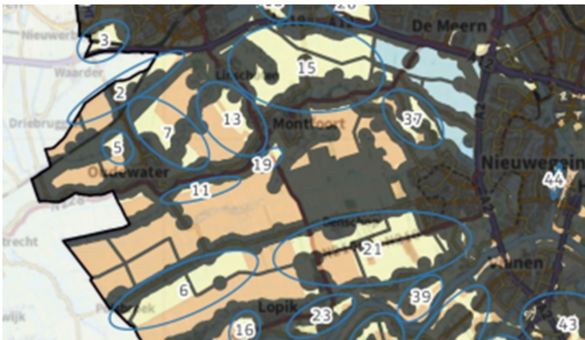
Figuur 2: Eerste inventarisatie in opdracht van de provincie Utrecht met mogelijke locaties voor windenergie.

Figuur 1: Potentieel zoekgebied windenergie (gebied G) voor na 2030, zoals vastgesteld in het Afwegingskader Duurzame Energie Oudewater.