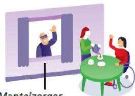
Mantelzorg kan er even uit

AANWEZIGHEIDSZORG Wmo, aanv. verzekering > Een vrijwilliger aan huis