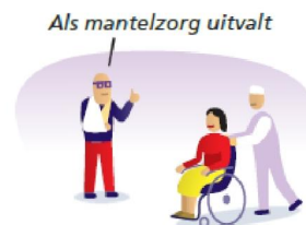
Als mantelzorg uitvalt

PROFESSIELE THUISZORG Zvw > Huisarts > Wijkverpleegkundige