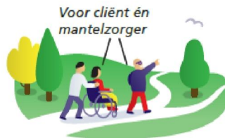
Voor cliënt én mantelzorg

'RESPIJTZORG LIGHT' Wmo > Activiteiten samen, met mogelijkheid om de zorg los te laten