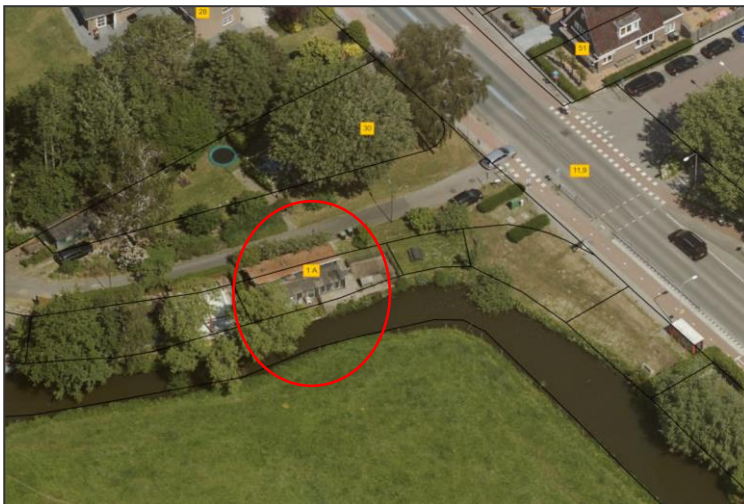
Figuur 1 Huidige locatie

Figuur 1 geeft de huidige situatie weer binnen de rode cirkel. De Tiny House wordt op het kavel van Oude Utrechtsestraatweg 1A in Oudewater gerealiseerd.