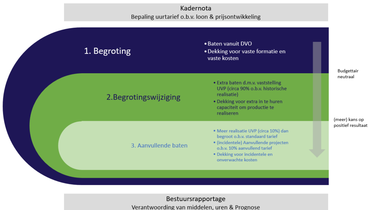
FIGUUR 2: BEGROTINGSMETHODIEK BIJ DE ODRU

Figuur 2 geeft de systematiek van begroten grafisch weer.