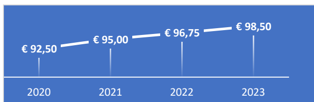
FIGUUR 1: ONTWIKKELING UURTARIEF

In figuur 4 is de tariefontwikkeling van de afgelopen vier jaar opgenomen. Rekening houdend met de nacalculatie voor 2021 1 en voorlopige nacalculatie voor 2022 van respectievelijk +0,95% en +2,04% volgens de systematiek in de kadernota (zie tabel 2) stijgt het tarief voor 2023 daardoor met 1,87%. Het tarief komt daarmee uit op: € 98,50. Voor uren boven de in de contracten vastgelegde uren (veelal aanvullende opdrachten) geldt een opslag van 10%.